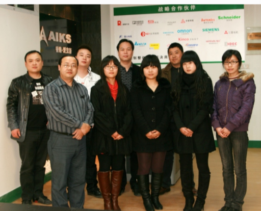
无锡爱克斯电气有限公司