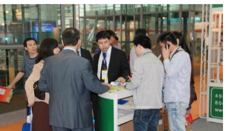
展位现场访客络绎不绝