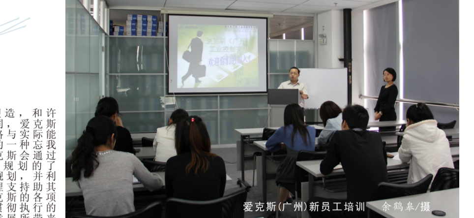
爱克斯(广州)新员工培训

爱克斯文化，是一种追求卓越、勇于创新的精神。它体现在爱克斯人对产品质量的严格要求，对技术创新的不懈追求，以及对客户服务的真诚态度。爱克斯文化，是一种团结协作、共同进步的精神。它体现在爱克斯人之间的相互支持、相互帮助，以及在面对困难时的齐心协力。爱克斯文化，是一种责任担当、勇于担当的精神。它体现在爱克斯人对社会责任的积极承担，以及对国家发展的无私奉献。爱克斯文化，是一种永不言败、永往直前的精神。它体现在爱克斯人对挑战的无畏面对，以及对胜利的坚定信念。爱克斯文化，是爱克斯集团发展的强大动力，也是爱克斯集团赢得市场、赢得客户的根本所在。