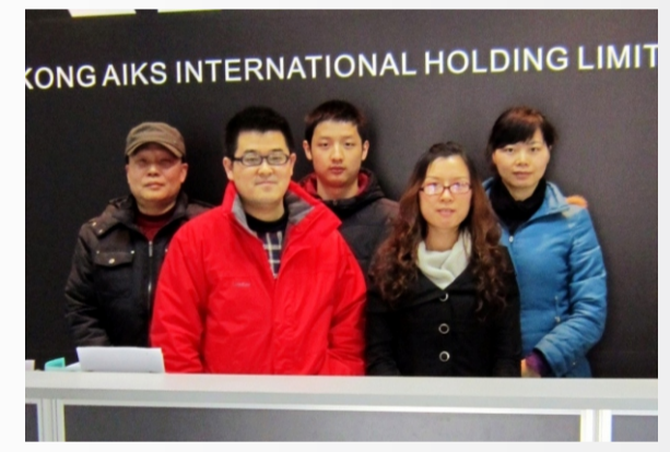
爱克斯(成都)工业控制有限公司

《爱克斯》报创刊号发行之际，爱克斯大家庭的成员们以及合作伙伴纷纷发来贺电表示祝贺！