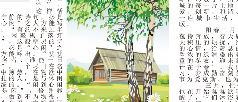
春天来了……ye!

阳春三月，春暖花开，正是踏青赏景的好时节。在这温暖的季节里，人们纷纷走出家门，去感受大自然的气息。公园里，花儿竞相绽放，散发出阵阵清香。田野里，麦苗青青，一片生机勃勃的景象。人们在这美丽的景色中，享受着春天的美好时光。阳春三月，春暖花开，正是踏青赏景的好时节。在这温暖的季节里，人们纷纷走出家门，去感受大自然的气息。公园里，花儿竞相绽放，散发出阵阵清香。田野里，麦苗青青，一片生机勃勃的景象。人们在这美丽的景色中，享受着春天的美好时光。