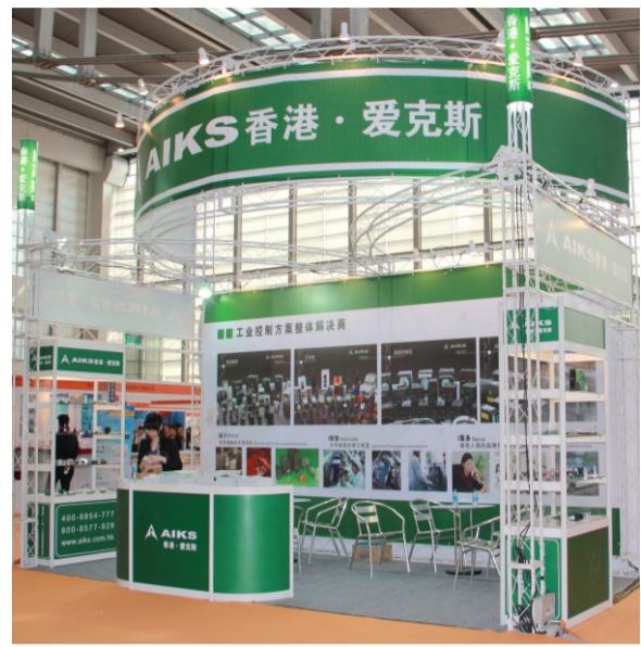
爱克斯集团特装展位

本届深圳消费电子展于4月10日开幕，爱克斯集团特装展位集体亮相，展示了包括工控变频器、伺服电机、PLC、变频器、变频器应用案例等在内的多款产品。展位设计现代、科技感十足，吸引了众多参观者驻足咨询。爱克斯集团此次参展，旨在展示其在工业自动化领域的最新成果，并加强与客户的沟通与合作。