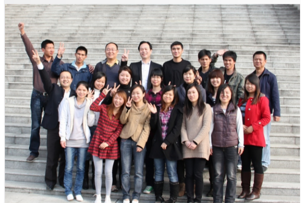
爱克斯(广州)工业控制有限公司